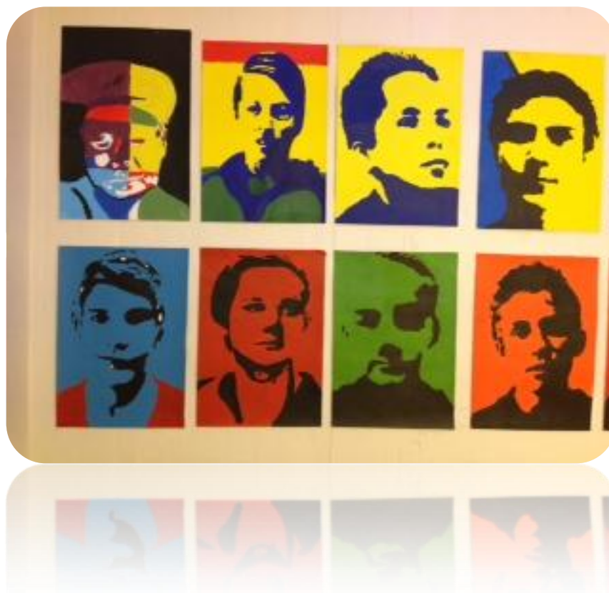
Elevarbeid, elever 9. trinn Skaun ungdomsskole

Generelt vil det være behov for mer oppfølging, både i form av tid og omfang, jo mer omfattende mobbinga var og hvor langt offeret kom i utviklinga av psykisk sykdom (Moen, 2014).