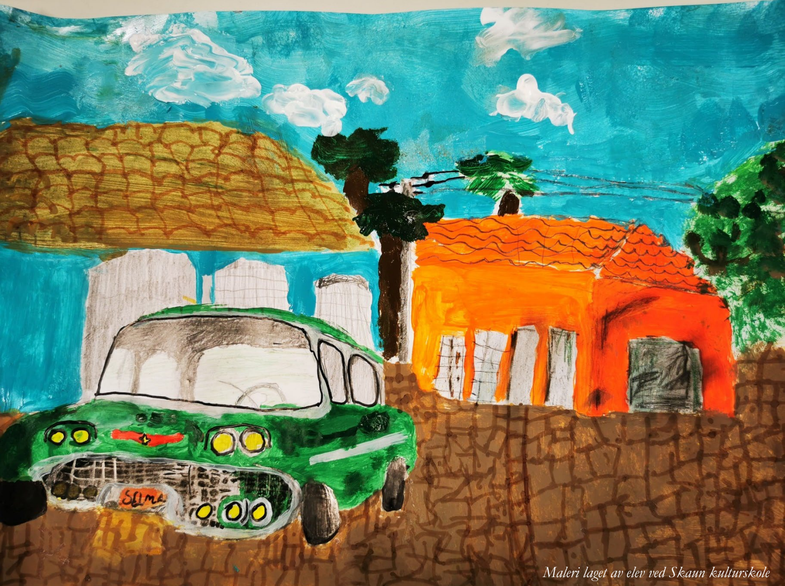
Maleri laget av elev ved Skaun kulturskole